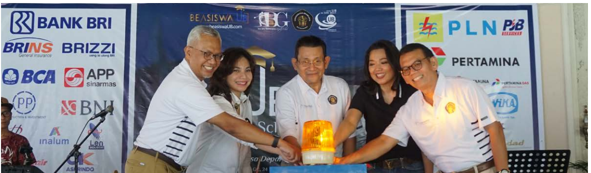
Soft Launching Produk Investasi Endowment Fund Brawijaya