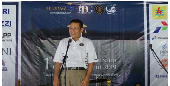
Sambutan Rektor UB