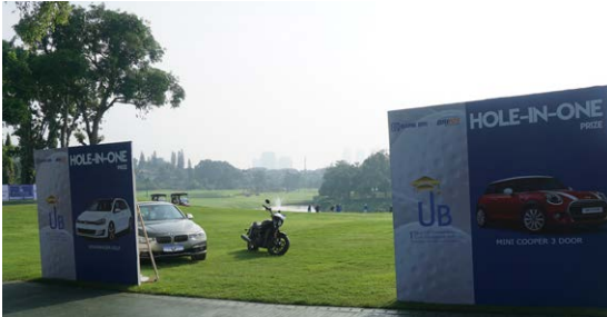
Hole In One Prize