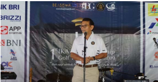
Sambutan Ketua IKA UB