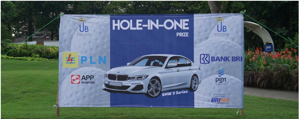
Spanduk HIO - BMW