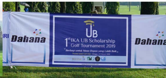
Spanduk Tee Box