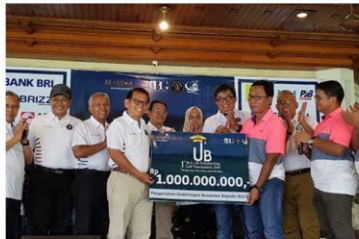
Acara turnamen golf beasiswa yang diselenggarakan oleh Ikatan Alumni Universitas Brwijaya (IKA UB) di Jakarta, Minggu (24/2/2019).

JAKARTA, KOMPAS.com – Ikatan Alumni Universitas Brwijaya (IKA UB) melakukan soft launching pembentukan produk investasi untuk dana abadi yang dinamakan Endowment Fund Brwijaya. Produk investasi ini berupa reksadana.