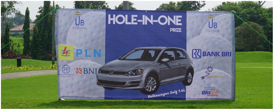
Spanduk HIO - VW