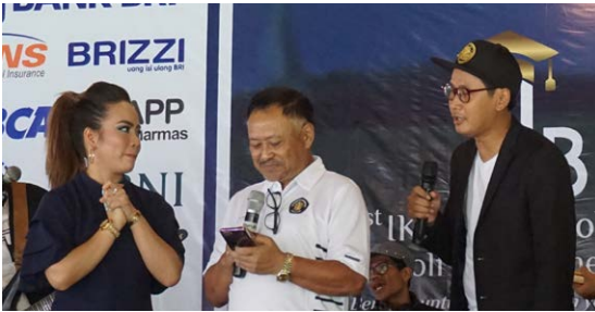
Hiburan - Sumbang Lagu