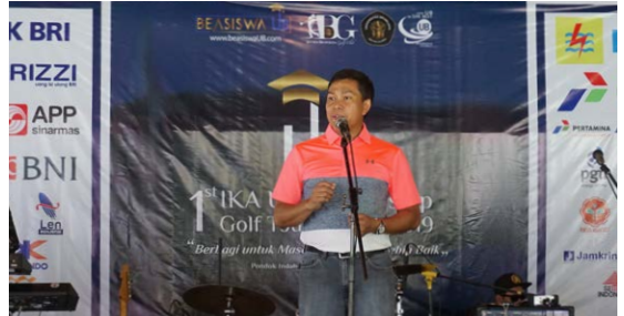
Sambutan Ketua ABG