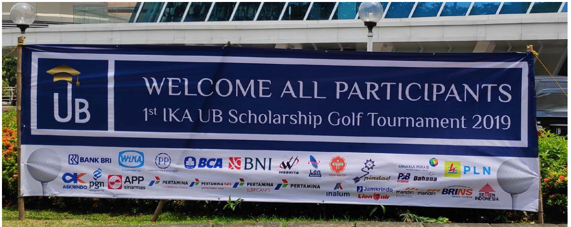
Spanduk Selamat Datang