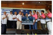
Turnamen Golf Ikatan Alumni Universitas Brawijaya Galang Beasiswa Rp1 Miliar - 01

Berita.com JAKARTA - Ikatan Alumni Universitas Brawijaya (IA UB) sukses menggelar turnamen golf dalam rangka penggalangan dana beasiswa guna mendukung kebutuhan pendidikan mahasiswa kurang mampu. Turnamen golf yang diikuti oleh 132 pemain dari perwakilan alumni, peraih juara sporta serta undangan tersebut berhasil menyumbangkan dana sebesar Rp1 miliar untuk mendukung program beasiswa Universitas Brawijaya.