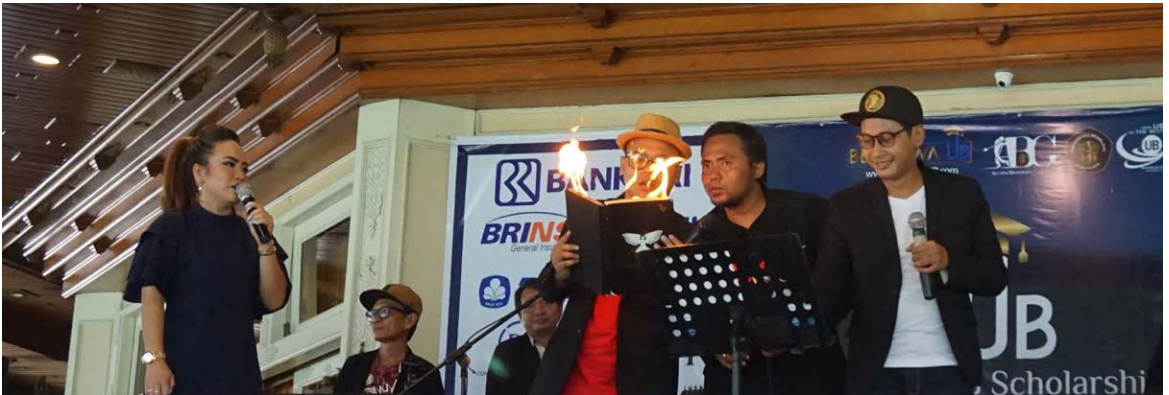
Hiburan - Kita Band