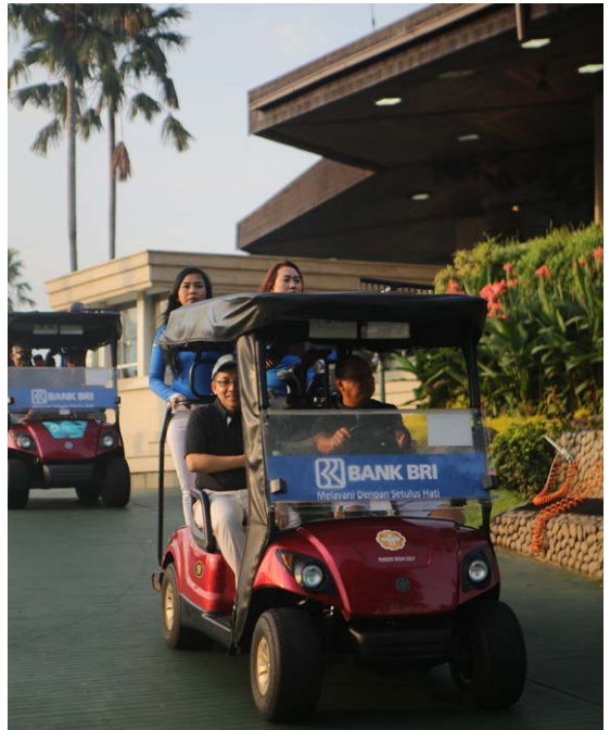
Peserta Menuju Tee Off