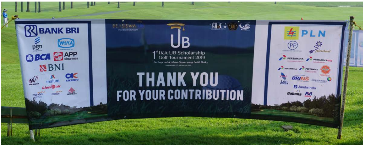
Spanduk Ucapan Terimakasih