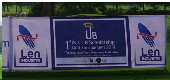
Spanduk Tee Box