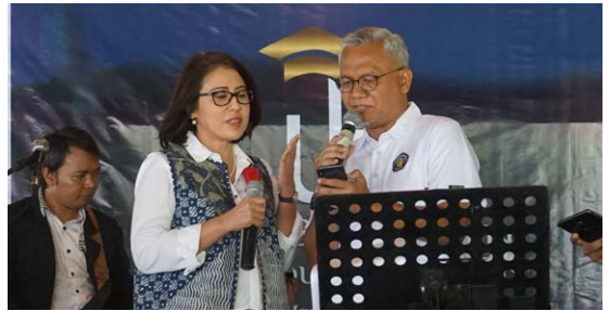
Hiburan - Sumbang Lagu