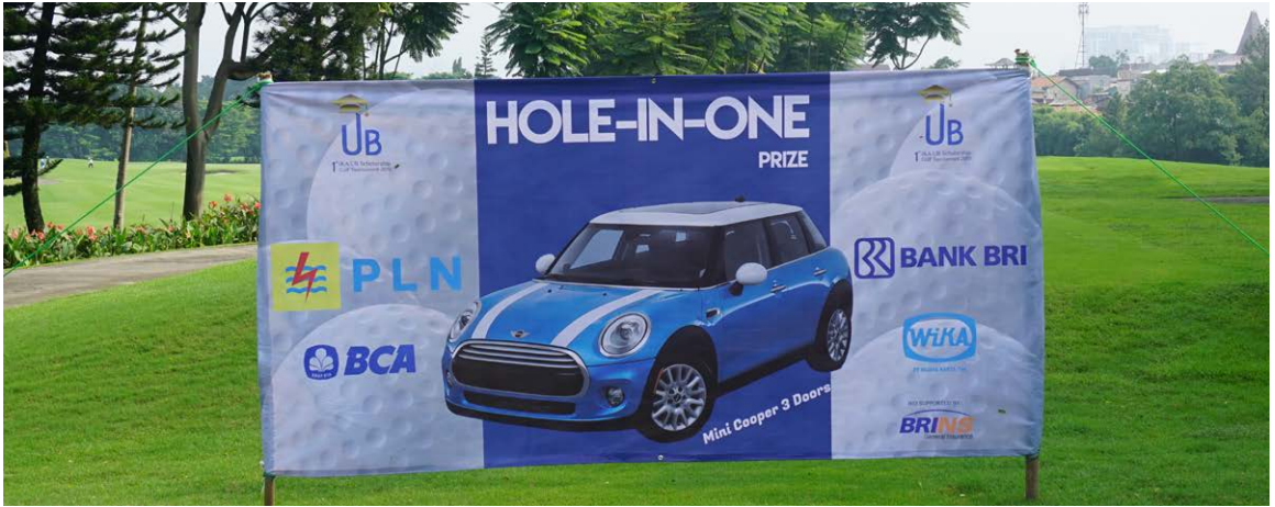
Spanduk HIO - Mini Cooper