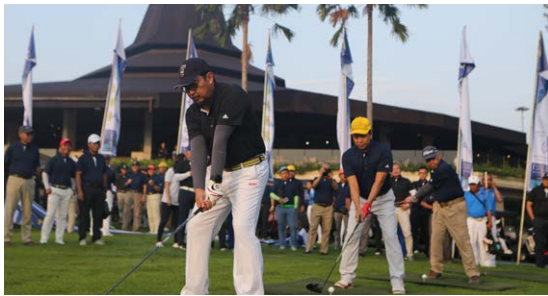
Pemukulan Bola Asap