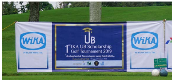
Spanduk Tee Box