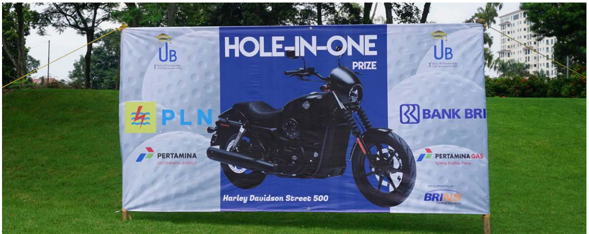
Spanduk HIO - Harley Davidson